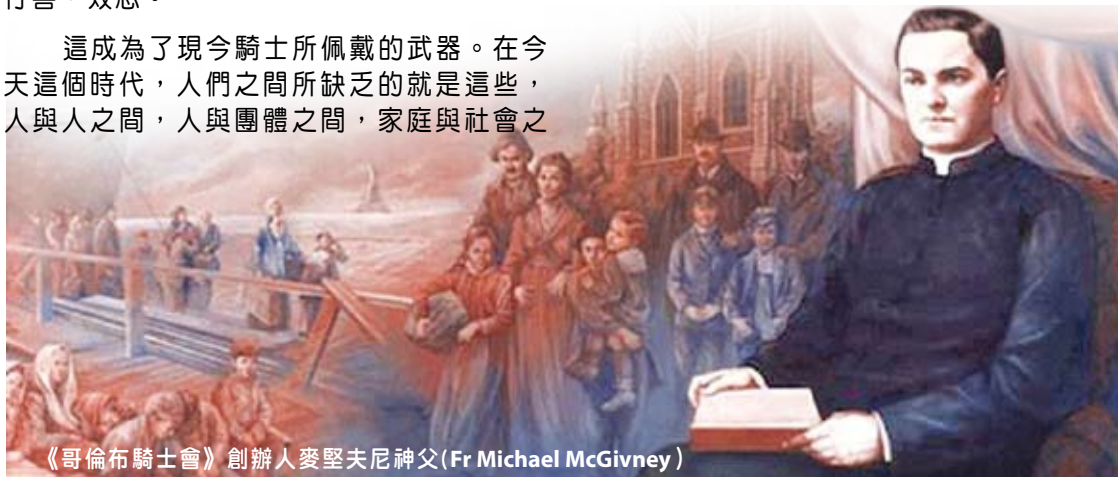
《哥倫布騎士會》創辦人麥堅夫尼神父(Fr Michael McGivney)