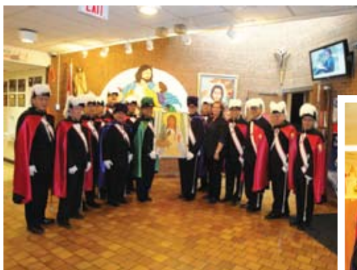
(下) 騎士們參與St Kateri Tekakwitha宣聖慶祝彌撒儀後合照。