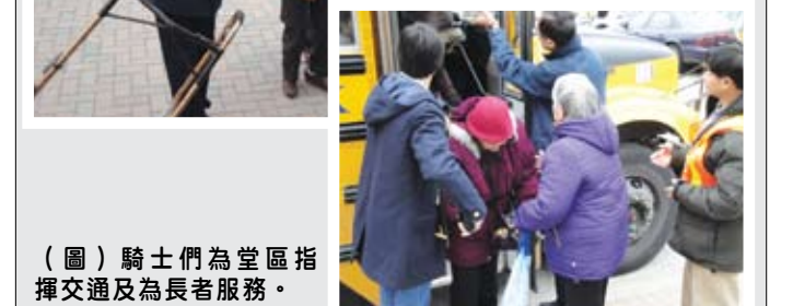
(圖) 騎士們為堂區指揮交通及為長者服務。