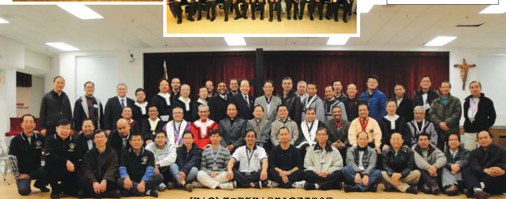
《騎士會》第二階新騎士兄弟入會禮儀後合照。